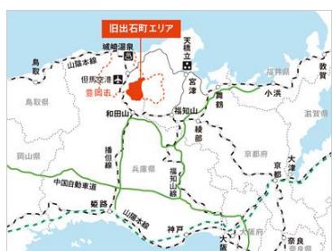
出石のまちの位置

出石の年間観光入込客数は約 100 万人、今や人口 1 万人強のこの町に、毎日 3000 人を超える人々が訪れていることになる。しかし、ここにくるまでには大変な苦労があった。それでは、この地の人々の知恵と金と労務とを結集した、類い希な観光まちづくりの軌跡を紹介しよう。