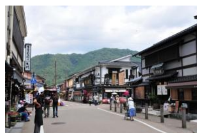
町の人の手による町並み修復