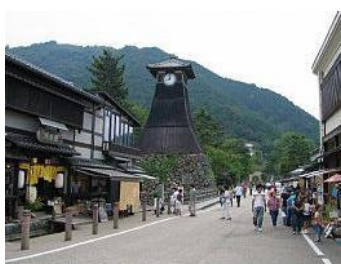
まちのランドマーク辰鼓楼