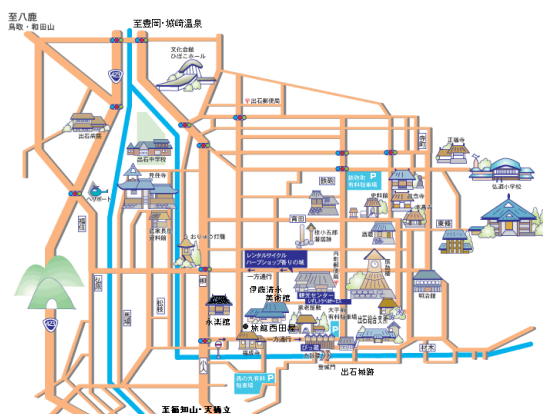
出石の観光資源マップ

※皿そばは、通常1人前5皿が供される。そばは地物として各店のオリジナルな絵付けがなされた、出石焼の白い小皿に盛られる。各店の皿を見るのも、そばを食する楽しみの一つである。1皿分のそばの量はほんの2口3口程度、物足りない人には1皿単位で追加注文できる店が多い。そばは実を丸引きし色は茶褐色、徳利に入ったダシと薬味の刻みネギ・おろし大根・おろしワサビ・トコロロ・生鶏卵1個が出される。そば猪口にダシと薬味を好みに応じトッピング、そばを浸して食べる。そばの製法も、江戸期に確立された「挽きたて」「打ちたて」「茹でたて」の”三たて”がある。これらを食べ分け多彩な味を楽しむことを信条としており、これが現代人の遊び心とあい出石そばは人気者となった。