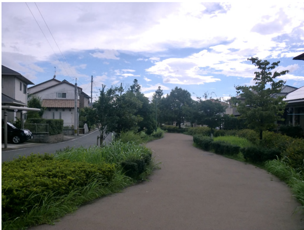
「住宅地の中を走る緑道」