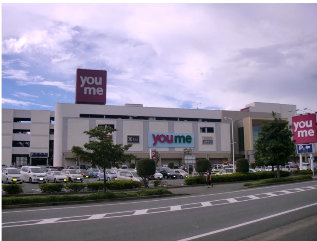
「商業施設『ゆめタウン光の森』」