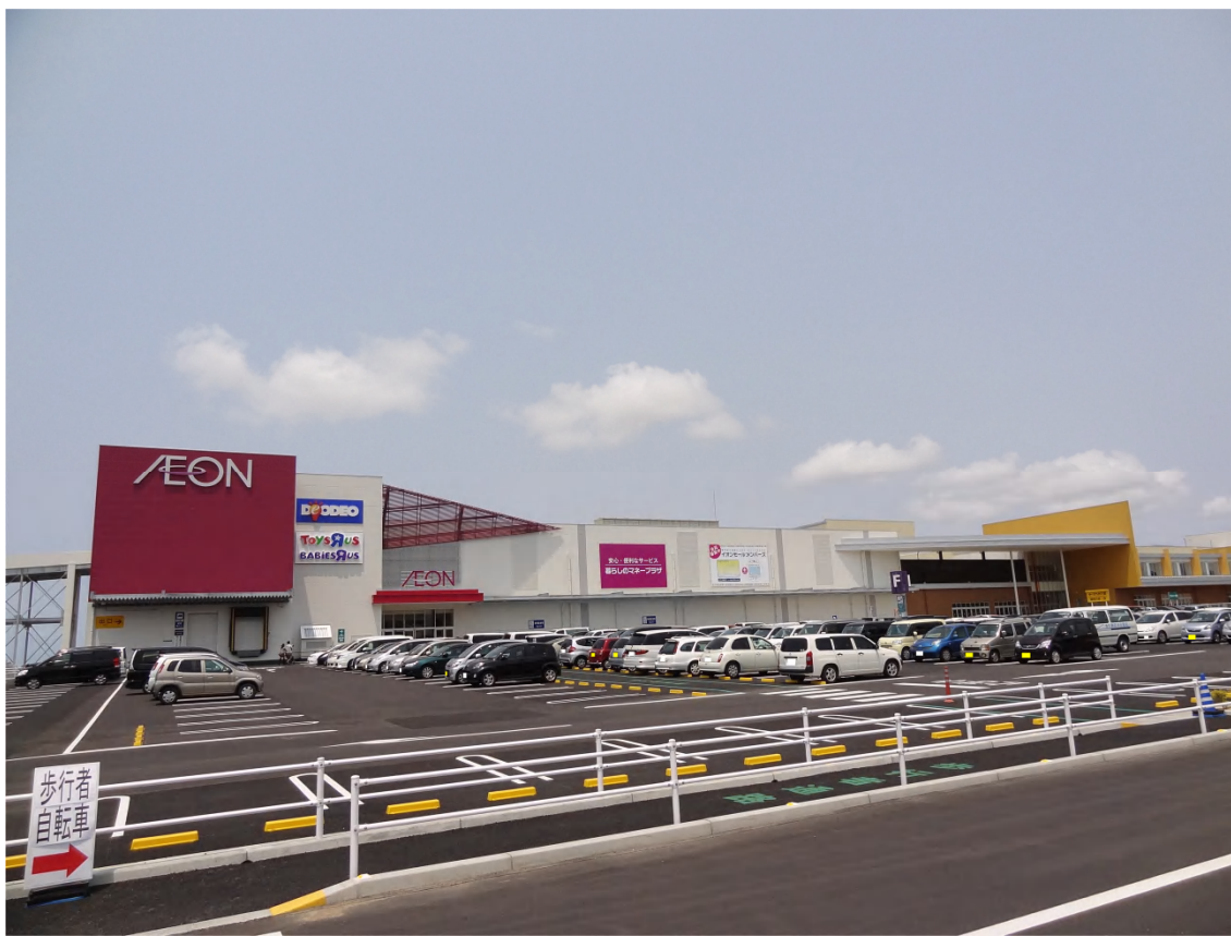
「イオンモール福津」