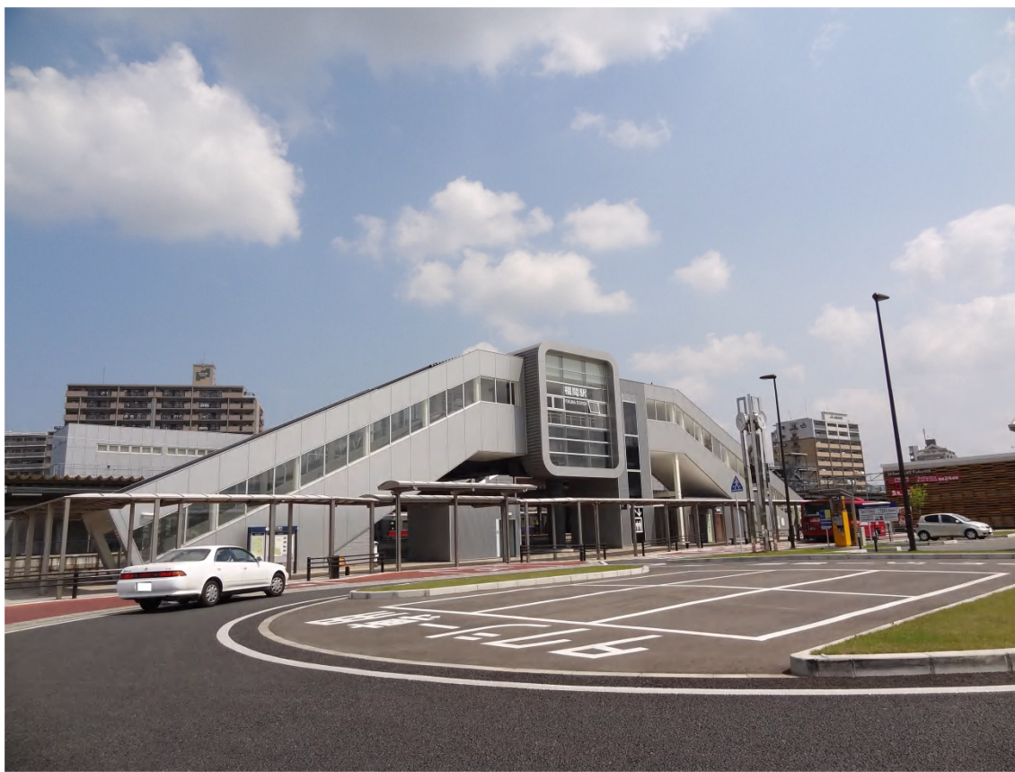
「JR 鹿児島本線福間駅東口」