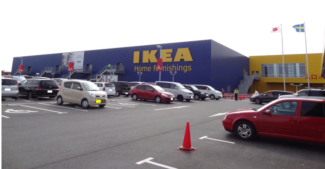
「イケア福岡新宮店」