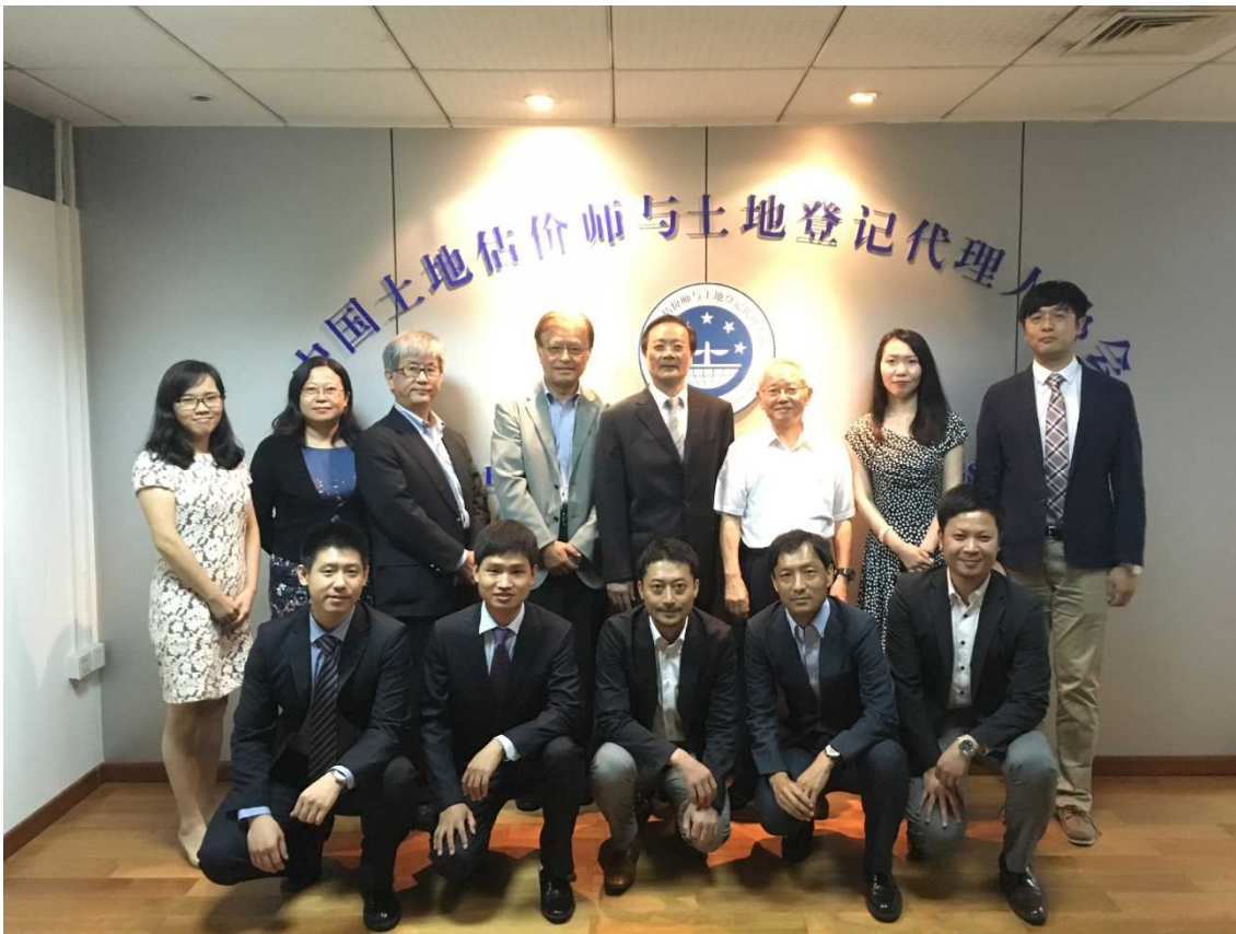
7月28日 中国土地評価師協会