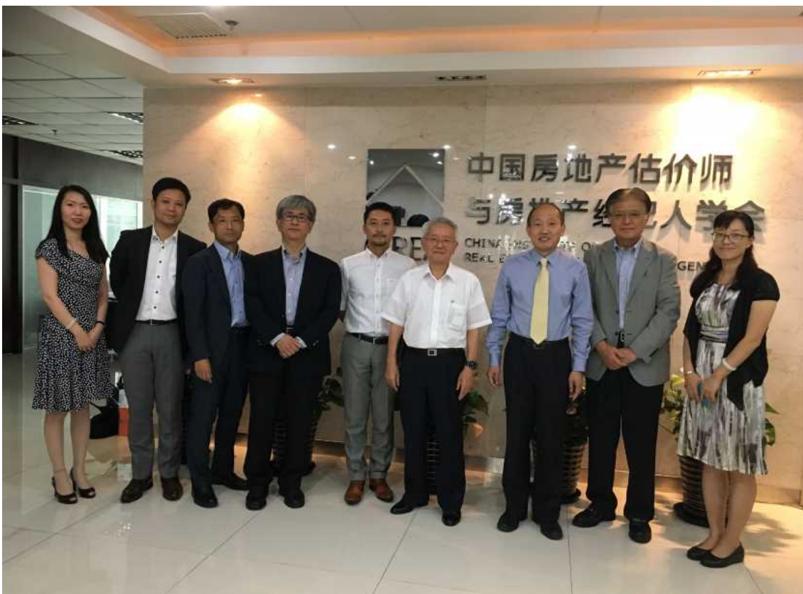
7月28日 中国房地產評價師協會