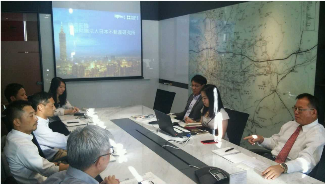
8月15日 REPro Knight Frank