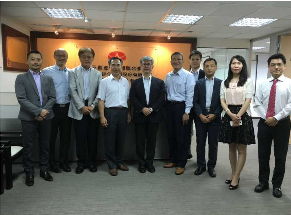
8月16日 宏大不動產評估師聯合事務所