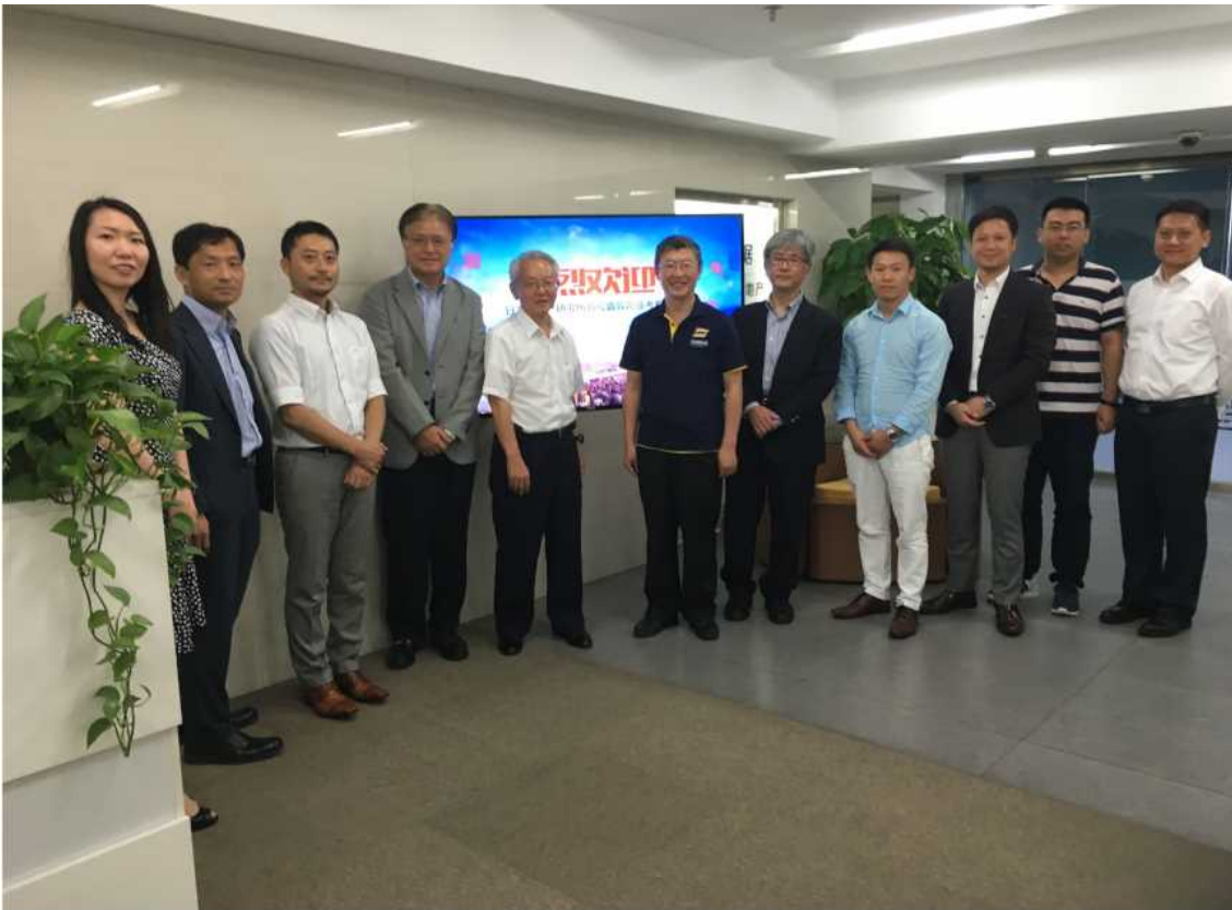
7月28日 北京仁達(HICグループ)