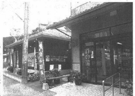
山口県の奥座敷にある俵山温泉。外湯「町の湯」(左)と野草茶のおいしいそば居酒屋「たべ山」